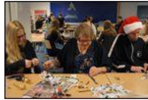
Klippe klistre dag december 2016