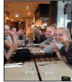
8. klasse i Budapest september/oktober 2016